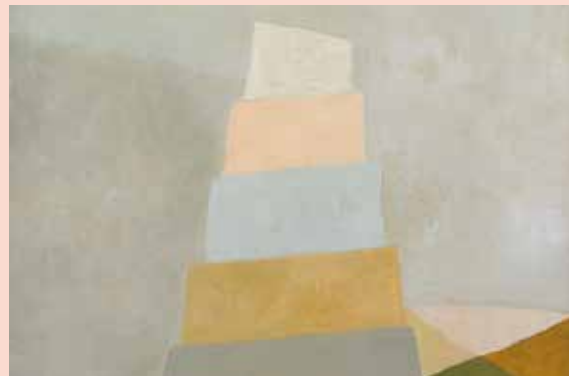
La Tour de Babel, Vera Pajeva

Tarif : 5 / 10 € - Réservations : 02 98 37 75 51